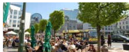
Place du Luxembourg