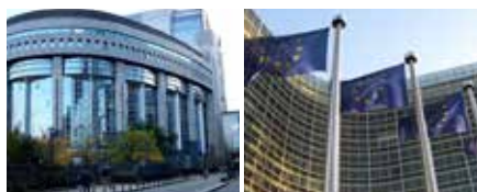
Parlement européen : Commission européenne